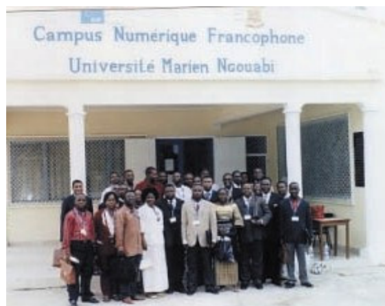
Les participants du colloque devant le Campus numérique francophone de Brazzaville

Le colloque a été placé sous le patronage du Recteur de l'Université Marien Nguabi de Brazzaville.