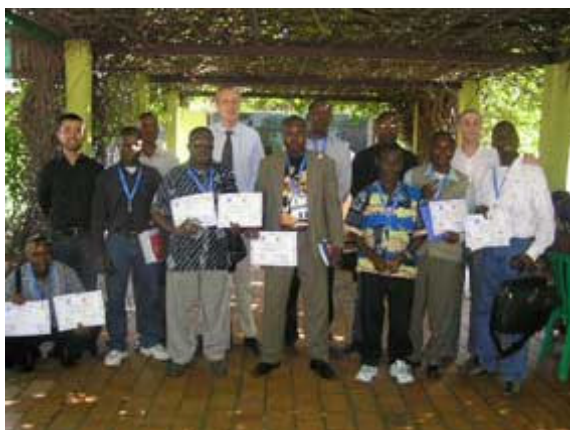
Les gestionnaires et techniciens des centres ADEN de Butembo, Kinsangani et Kamelie à l'issue de leur formation

Du 3 au 15 novembre 2006, le Campus numérique francophone de Kinshasa a accueilli trois sessions de formation destinées aux gestionnaires et techniciens des centres ADEN de Butembo, Kisangani, et Kalemie ainsi qu'à quelques personnels des universités de la République démocratique du Congo.