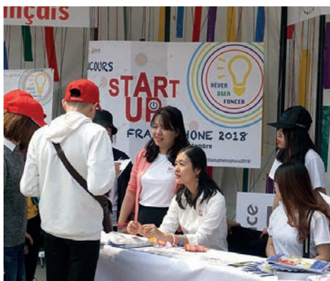
En Asie, l'AUF a lancé le concours « Startup ! L'esprit entrepreneurial » pour soutenir et accompagner dans la durée, avec ses partenaires, les idées et projets innovants portés par des étudiants du Vietnam, du Laos et du Cambodge.