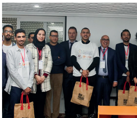
L'incubateur francophone maghrébin, créé par l'AUF et le Centre Marocain pour l'Innovation et l'Entrepreneuriat Social (MICSE), identifie et développe des projets d'entreprises innovantes à impact social, portés par des étudiants du Maghreb.