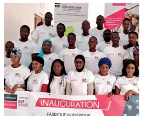
La « Fabrique Simplon », inaugurée le 31 mars 2018 à Dakar, permettra d'accompagner et de former aux nouveaux métiers de l'économie du numérique, des jeunes de 18 à 30 ans en difficulté d'intégration dans le monde du travail.