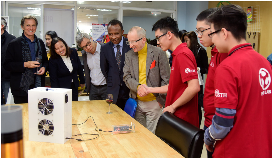
Cérémonie d'inauguration du campus numérique de l'USTH (Vietnam).