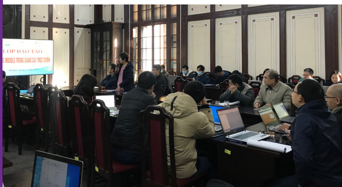
Ateliers E-formation à destination des enseignants de l'Université de Pharmacie de Hanoi (Vietnam), partenaire du projet.

Soutenu par la Fondation Pierre Fabre, le Réseau Mékong Pharma vient à la suite du programme Master Mékong Pharma. Démarré en 2020 pour une durée de 5 ans, ce réseau contribue à l'échange de connaissances en sciences pharmaceutiques au profit des enseignants des quatre universités d'Asie du Sud-Est initialement partenaires dans le Master Mékong Pharma (Université de Pharmacie d'Hanoi, Université de Pharmacie et de Médecine de HCMV, Université des Sciences de la Santé du Cambodge et Université des Sciences de la Santé du Laos). Ceux-ci pourront à leur tour former de futurs pharmaciens au meilleur niveau pour qu'ils puissent, dans les institutions publiques ou privées où ils travailleront, garantir la qualité du médicament. Avec la contribution des experts scientifiques du monde académique et de l'industrie, seront organisés des séminaires spécialisés adaptés aux besoins des enseignants et des universités dans des disciplines pharmaceutiques prioritaires pour les pays concernés, en fonction des enjeux de santé publique.