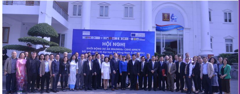
Le projet est porté par l'Université de Hanoi.

La dynamique universitaire au sein de la région Asie du Sud-Est s'inscrit dans un environnement en mutation, qu'il soit économique, environnemental, technologique, culturel, social ou juridique. À ce défi s'en ajoute un second : une volonté politique des gouvernements cambodgien et vietnamien d'autonomisation des établissements d'enseignement supérieur. Les établissements seront donc amenés à repenser leurs modèles de gouvernance universitaire, les orientations stratégiques de leurs plans de développement en tenant compte de leur degré d'autonomisation dans la définition d'une gestion prospective des ressources humaines et d'une politique partenariale.