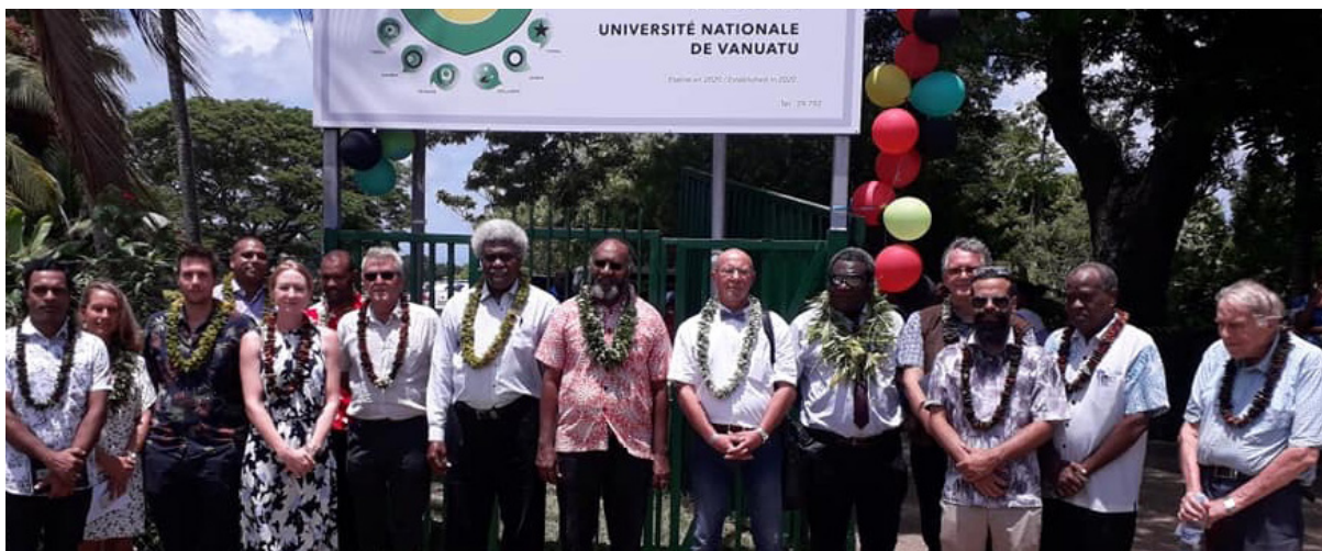
Cérémonie d'inauguration de l'Université nationale du Vanuatu, le 29 février 2020.

Les valeurs qui président à la création de l'Université nationale du Vanuatu sont également celles promues par l'AUF à travers le monde : celles d'universités francophones ouvertes sur les autres langues et les cultures, soucieuses de répondre aux défis sociétaux de leurs pays respectifs et particulièrement aux aspirations des jeunes tant en termes d'apprentissage du savoir que d'employabilité et de professionnalisation.