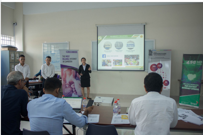
Concours « Techno Innovation Challenge Cambodia 2020 »

Plus de 100 acteurs ont participé à la « Journée de création, de start-up et d'échanges culturels Franco-Vietnamien » organisée dans le cadre du projet « ECOBOOT - Écosystème de start-up innovante » piloté par l'Université de Hue. À travers cet événement, 14 projets soutenus et incubés par l'Ecosystème de l'Innovation et de l'entrepreneuriat de l'Université de Hue ont été présentés et promus auprès des cadres, des enseignants et aussi des représentants des acteurs socio-économiques locaux.