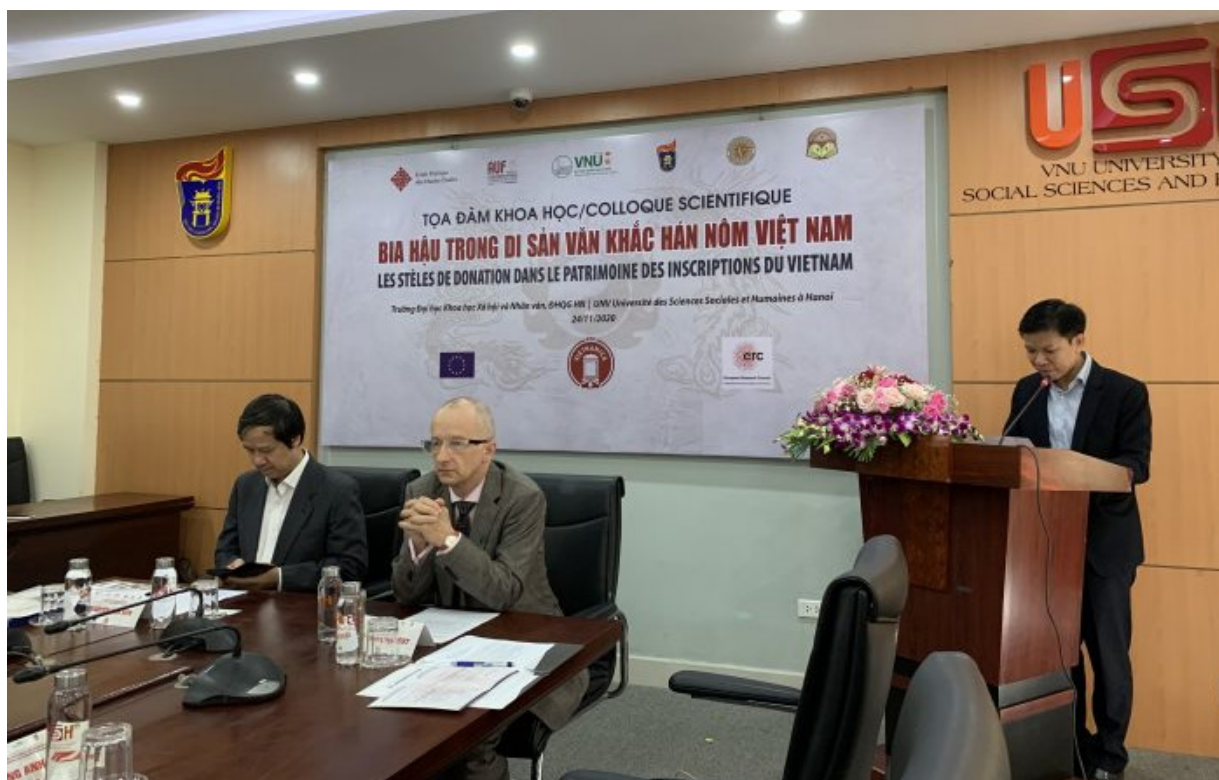
Colloque scientifique « Les stèles de donation dans le patrimoine des inscriptions du Vietnam » organisé le 24 novembre 2020 dans le cadre du projet ERC Vietnamica.

Le colloque du 24 novembre 2020, marquant la fin de la première année du programme, a donné aux partenaires l'occasion de faire, en présence de l'AUF Asie-Pacifique, un bilan sur l'état d'avancement du projet et d'échanger sur les valeurs de stèles de donation, un type épigraphique original et unique en Asie et qui occupe une place essentielle dans le trésor des inscriptions gravées du Vietnam.