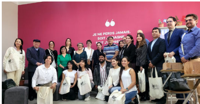
L'inauguration du premier CEF de Bolivie au sein du campus de l'Universidad Mayor de San Simón (UMSS) à Cochabamba.

Les étudiants sont les principaux bénéficiaires des services offerts par nos sept Centres d'Employabilité francophones - Campus numériques francophones (CEF - CNF) , soit en tant que futurs demandeurs d'emploi soit en tant que futurs entrepreneurs ou travailleurs indépendants. Nos CEF - CNF se trouvent en Argentine, en Bolivie, au Brésil, au Chili, en Colombie et en Mexique.