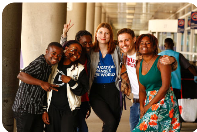
L'association Programme Étudiant·e·s Réfugié·e·s de l'Université du Québec à Montréal (PÉR UQAM), membre du réseau CLÉF depuis 2023.