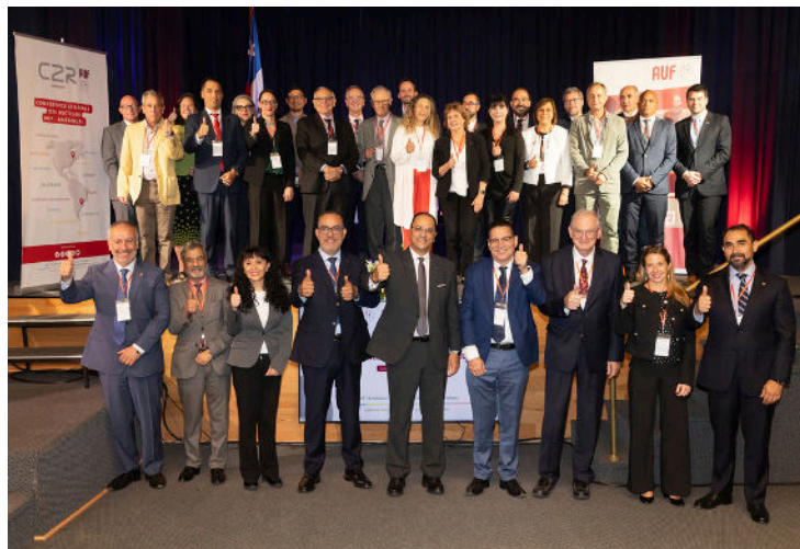
Conférence régionale des recteurs des établissements membres de l'AUF dans les Amériques (C2R Amériques), les 24 et 25 octobre 2024, à l'Université Bernardo O'Higgins à Santiago, Chili.

Elle joue un rôle essentiel dans l'identification des domaines d'expertise de ses membres, en encourageant une dynamique de solidarité active, ainsi que dans la définition des orientations stratégiques en matière d'enseignement supérieur et de recherche. Son assemblée générale se tient chaque année.